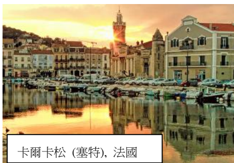
卡爾卡松 (塞特), 法國