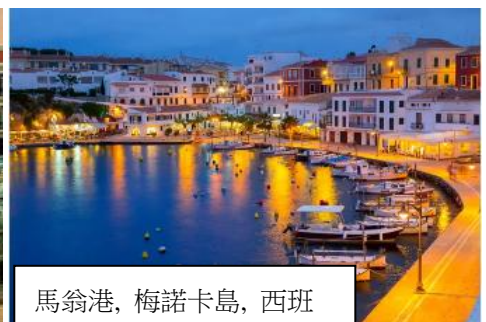
馬翁港, 梅諾卡島, 西班