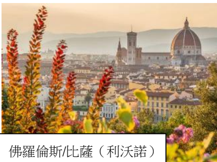
佛羅倫斯/比薩 (利沃諾)

以上航程、停泊港口及預計到達/離開時間僅供參考·如有更改·恕不另行通知。 #需乘坐接駁船來往港口及岸邊。