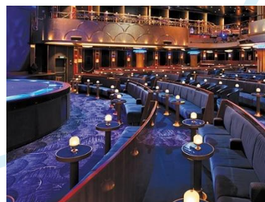
Theatre 劇場 樓層：4, 5 兩層樓高的表演廳擁有完美的視線