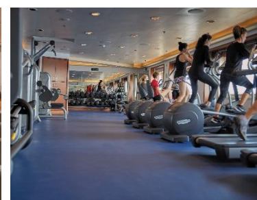
Fitness Center 健身中心 樓層：6 提供最合適的訓練指導。豐富多彩的團體健身課程、瑜珈到动感單車