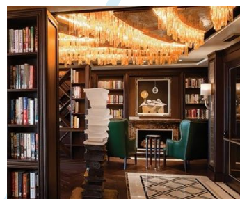
Library 圖書館 樓層：6 盡情享受這片靜謐空間的寧靜。