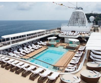
Pool 泳池 樓層：11 恆溫泳池中放鬆身心，盡情暢遊

身為全球最全面的奢華體驗，麗晶七海郵輪®為您提供無限精彩的旅程。下午茶時間，與志同道合的旅伴隊參加趣味問答遊戲。在私人陽台上，裹著柔軟溫暖的毯子，捧讀一本好書，享受愜意時光。前往配備先進設施的健身中心，參加活力四射的課程，煥發身心活力；或體驗奢華水療護理，放鬆身心，煥然一新。