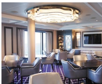
Card Room 棋牌室 樓層：4 玩遊戲或聊天的理想場所