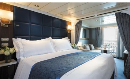
尊貴露台套房 Deluxe Veranda Suite Cat F, G, H (可入住人數:2-3人) 客艙面積 (平方米)：28.4 + 4.7 樓層：6-8

每間套房都設有私人陽台，浴室採用大理石裝飾，並配有寬敞的衣櫃。您可以一邊品嚐咖啡或葡萄酒，一邊享用客房送餐服務，在戶外用餐，同時欣賞無限海景，呼吸清新海風。