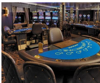
Casino 賭場 樓層：4 賭場環境優雅可以在撲克桌上挑戰。不妨在老虎機錦標賽中試試手氣