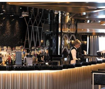
Bars & Lounges 酒吧和休息室 多達五間酒吧和酒廊，可以在晚餐前小酌一杯