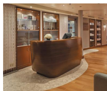
SERENE SPA 水療中心 樓層：6 盡情享受按摩、身體敷裹、臉部護理、美甲、美髮服務等等