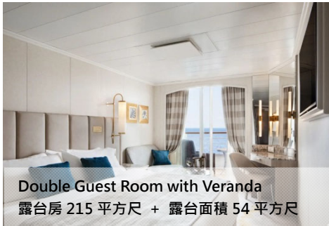
Double Guest Room with Veranda 露台房 215 平方尺 + 露台面積 54 平方尺