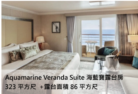
Aquamarine Veranda Suite 海藍寶露台房 323 平方尺 + 露台面積 86 平方尺