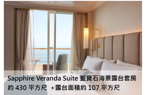
Sapphire Veranda Suite 藍寶石海景露台套房 約 430 平方尺 + 露台面積約 107 平方尺