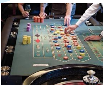
Casinos At Sea®賭場 樓層：6