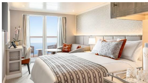
海景露台房 (可入住人數:2-3人) Veranda Stateroom 客艙面積 (平方尺)：291 樓層：7、8