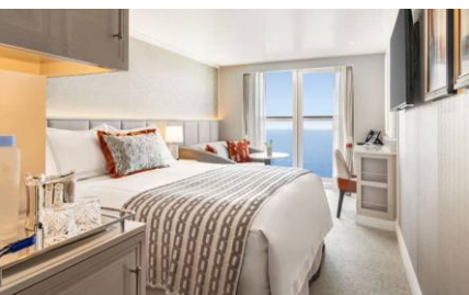
法式露台房 (可入住人數:2-3人) French Veranda Stateroom 客艙面積 (平方尺)：240 樓層：7