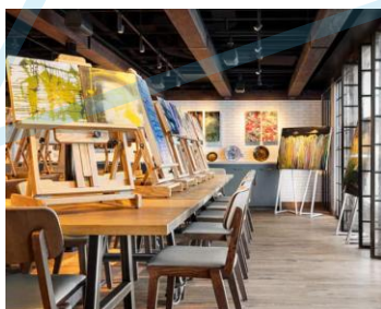
Artist Loft 藝術家工作室 樓層：14 需額外付費