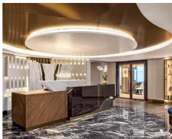
Aquamar Spa 水療中心 樓層：15 需額外付費