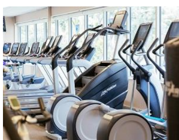
Fitness Center 健身中心 樓層：15