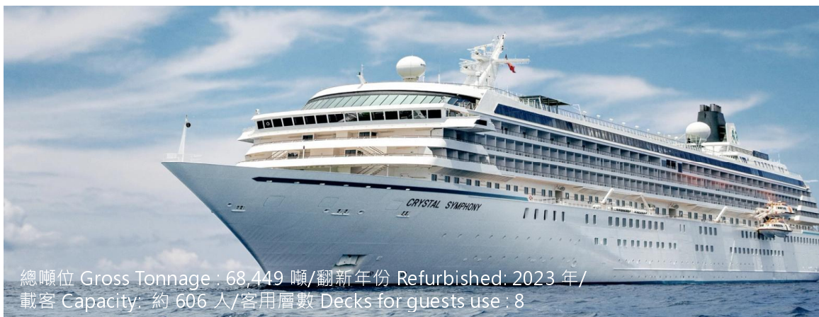
總噸位 Gross Tonnage : 68,449 噸/翻新年份 Refurbished: 2023 年/ 載客 Capacity: 約 606 人/客用層數 Decks for guests use : 8